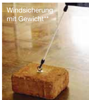
Windsicherung mit Gewicht**