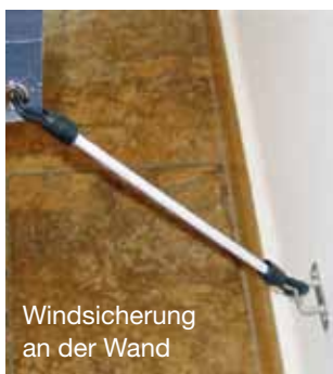
Windsicherung an der Wand